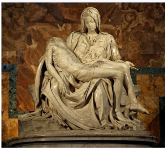
تمثال بيتا لمايكل انجلو و صورة بيتا انفجار بيروت 2020

كتبه الأستاذان الدكتور يوسف العاقوري (الباحث والمعالج والمستشار النفسي و رئيس قسم علم النفس في الجامعة اللبنانية) والأستاذ جورج أبو مرعي (الانثبائي النفسي) مقالتهما المعنونة "انفجار مرفأ بيروت صدمة نفسية حديثة تكسسه فوق صدمات سابقة".